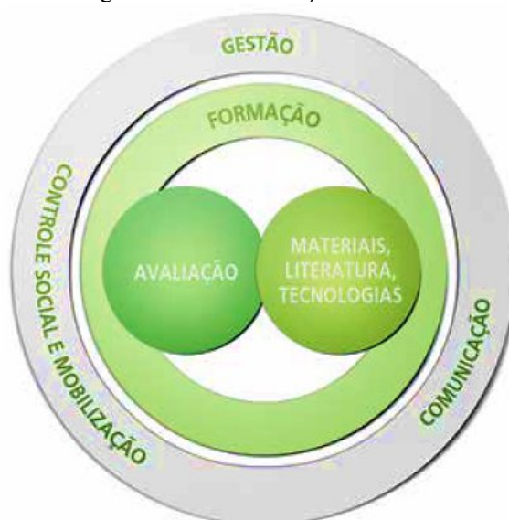
Figura 1. Eixos de atuação do PNAIC

A formação do PNAIC está estruturada em torno de quatro eixos principais, sendo eles: a formação continuada; os materiais didáticos, literaturas e tecnologias educacionais; a gestão, controle e mobilização social; e avaliação, sendo este último o foco deste trabalho.